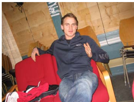
"Ja, eg lige altså lange turar i skogen og rolige kvellar foran peisen. Så bare ring damer! Eg vente her på dåkke!"

etter intim jule speling på Nærland, va det egentlig ikkje nokon konkurranse.