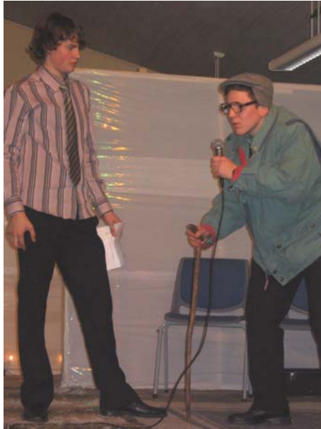
... Me fekk besøg frå den eldre garde: -"Nja du vett før så hadde me ikkje nyttår og slikt. Ja ja me hadde nå ein slig ein primstav me dreiv å snudde på, men ikkje någe meir."

var samla for å gå saman inn i det nye året. Nokon feira slutten på 2005, andre byrjinga på 2006.