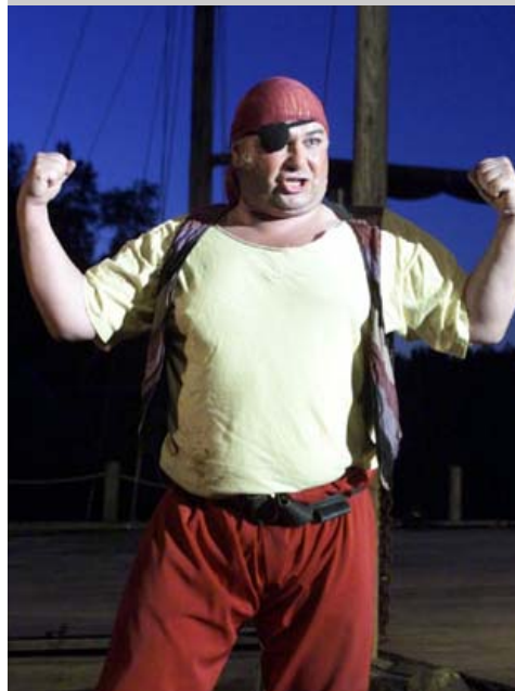
Har Piraten Pysa frå kaptein Sabeltann sitt mannskap...