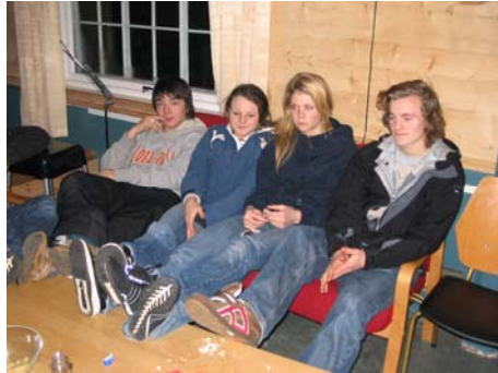
"Bare se, men ikke røre! Det har mor så ofte sagt..."

gammel årgang. Så vellagret og overmodne at de følte det var på tide å undervise i barneoppdragelse. I god Se&Hør-stil gikk de julebuk på scenen med iulage skjult blant publikum. Latte- ren satt løst, men kanskje mest på grunn av at Øystein fant det litt vel vanskelig å gå med sko på knærne. Så neste gang bør det vel jobbes litt mer med koreografien. Poengene var bra, men er blitt sensurert av vær- ekstremt- varsomplakaten, slik at det ikke kan gjengis her.