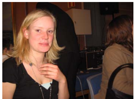
...Någen va sje heilt fornødde me maden.

Etter ein rask kjøyretur tilbake frå kyrka var det tid for sjølve essensen i nyttårsafta. Me var tilbake på Utsyn fem på tolv, og blei møtt av rakettar og feststemning.