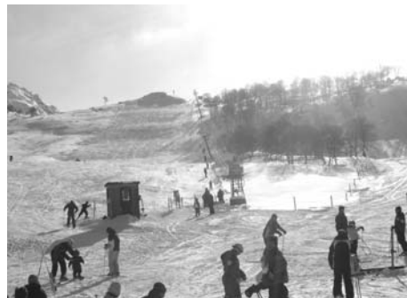
Mars: Stavtjørnweekend. Vere la i alle fall ingen dempar på helgå!