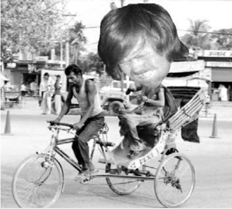
Kjetil i damekler i et vanligt framkomstmid- del i ett av svarå (bilde e ikkje der frå)

12. I denne byen kan man slappe av på verdens kanskje mest berømte strand. Man kan også se verdens største fotballstadion og verdens mest kjente Kristusstatue. Byen har store sosiale problemer som setter en viss stopp for de store tu-