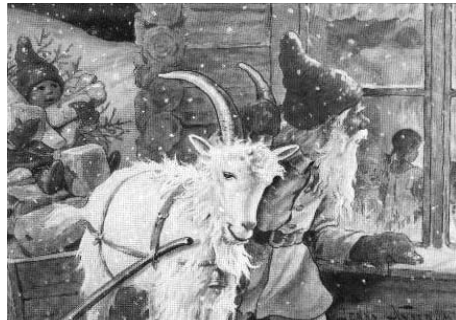
Ekta skandinaviske nisse, ikkje någe Coca Cola-tul!