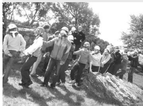
Juni: Deltagarane på inspirasjonsturen t Bru lerte ett og aent om kvarandre på turen.