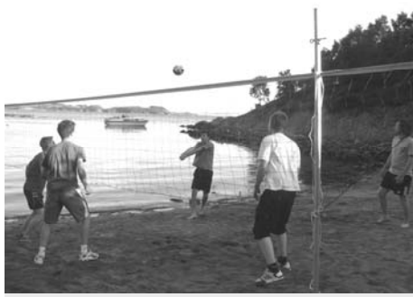
Juli: Volleyball i Kvitevik e ein fast sommartradisjon.