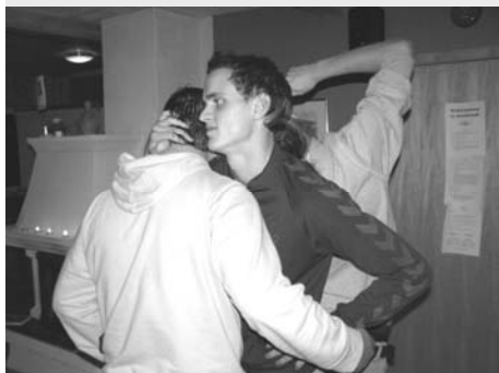
Oktober: Nærleiksweekenden t Kvinatrun