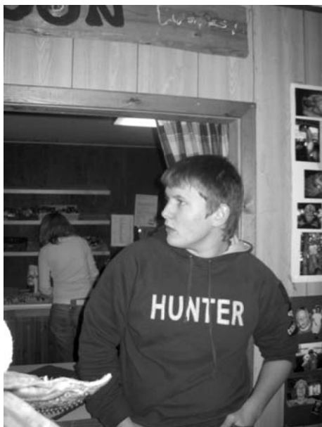
Allti når desperadoen Billy the Bleie gjekk inn i saloonen stoppa musikken.