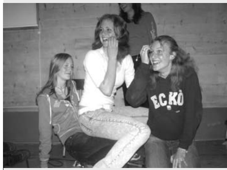
August: Opningsfesten i år engasjerte publikum i nye merkelige settingar.