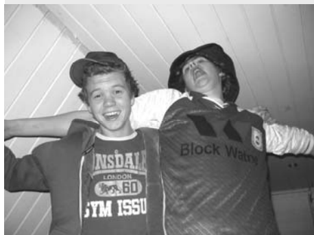
November: Oss fotballgalne fekk endelig vår kvell på Lauvsnes med "Fotballkveld"!