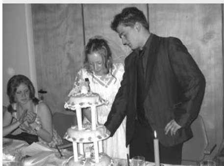
April: Rollespel e någe ungdomslage virkelikt kan! Bryllupet blei ein stor suksess.