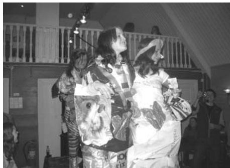
Februar: Plastic fantastic utfordra dei kreative moteskaparevne t deltakarane.