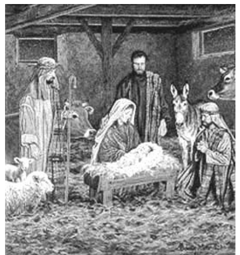
De sjølsagt dette som e d viktigaste med julå!