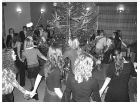
Desember: Så går vi rundt om en enerbærbusk seint en 2. dagsfest.