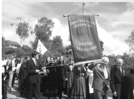
Mai: Ungdomslage ga lyd frå seg i folkatoge og I u-lage-bilen vant bilkortesen.