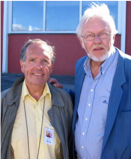
Kjendisane på tomatfestivalen va bl.a. Rike å