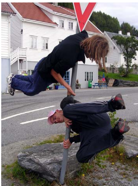
– blåturen va gudd den, men den manglande tyngdekraftå på Nedstrand ødela litt