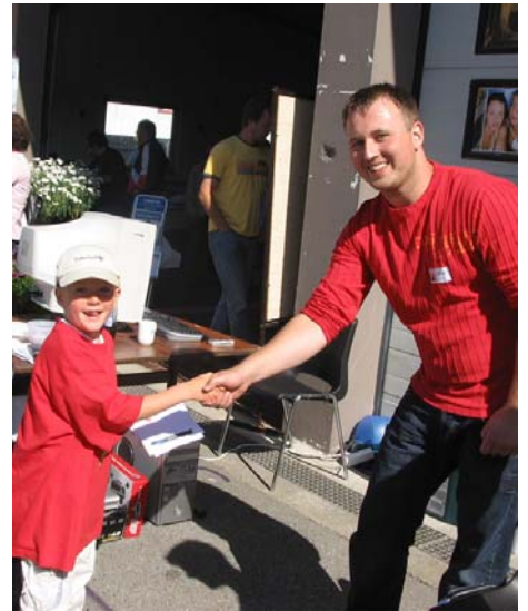
Henning verve folk t Ildstadjugend.