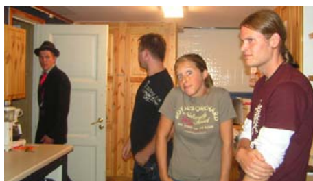
"Manus? Nei det har vi ik..ikke sett"

Og glae 8 klassingar jekk sakte, men sikkert kvar t sitt.