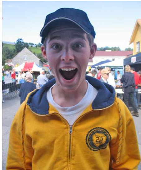
...å Titten Tei.