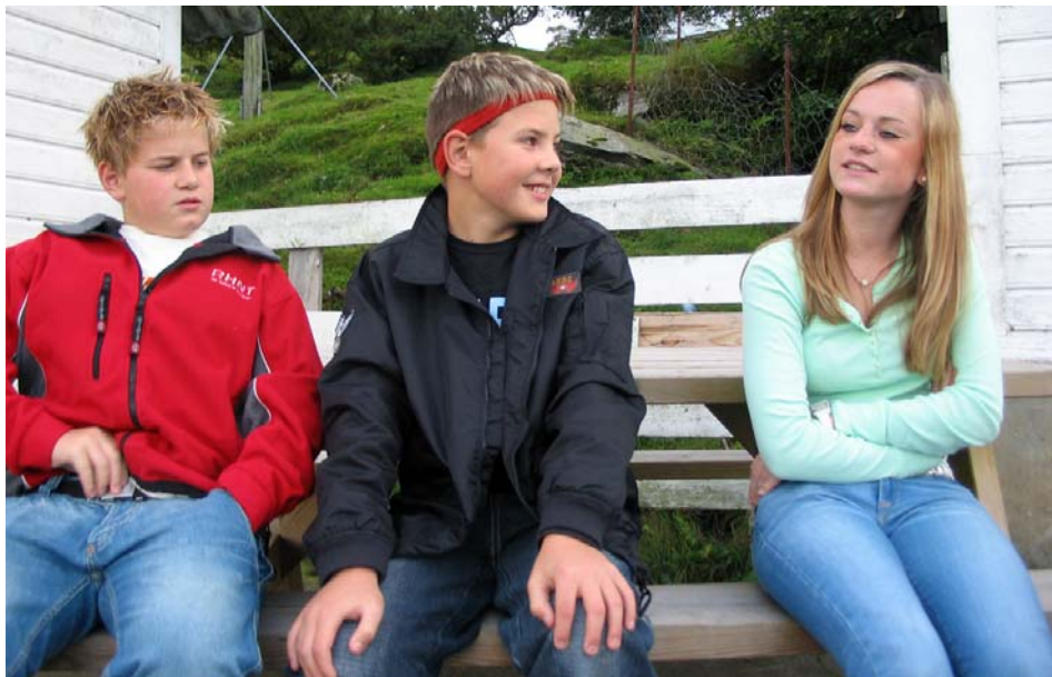
"Duu? Om atte d e sant atte dåkke jenter har jentelus?"

Av: Jakob Steinnes og Ole Andreas Sivertsen