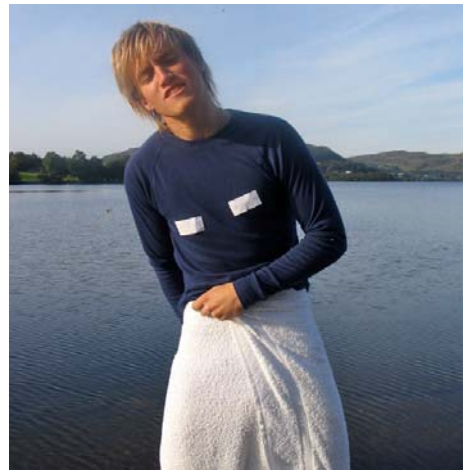
"Greitt nok at speedo e sexy, men d e hendelse å ta di av å på"

Neste programpost var bading, der det var poeng til det laget med flest uti. Herifrå var det ingen tvil om at "Team Roger" var i ein klasse for seg sjølv. Etter badinga gjekk me opp til huset, innkvarterte oss og vaska dassen.