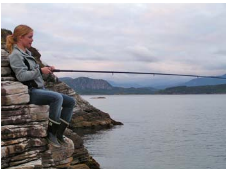
Ganske bra bilde

Ittekvart så tiå jekk kom der flerre og flerre folk tuslane. Så når klokka nærma seg hal ti kunne me endelig begynna. Då