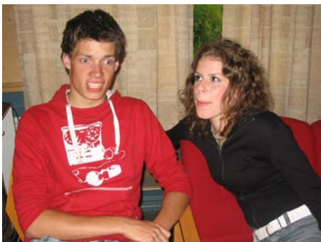
"Sjå! Sjå nå! Rikke eg på øyrene nå?"

Videre på min nysgjerrighetstur møtte eg fleire muntre smil, folk som potla på med sitt, og i kjøkkenkroken blei kveldens leker lagt heilt klare. Då klokka runda tjueein va det klart for å starta arrangementet offisielt, någe som blei gjort på ein rørende fine måte, nemlig med songinnslaget eg hadde fått