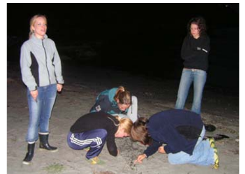
"5 789 568 sandkorn, 5 789 569 sandkorn, 5 789 6.. Fadderullan, nå myssta eg tellingå!"