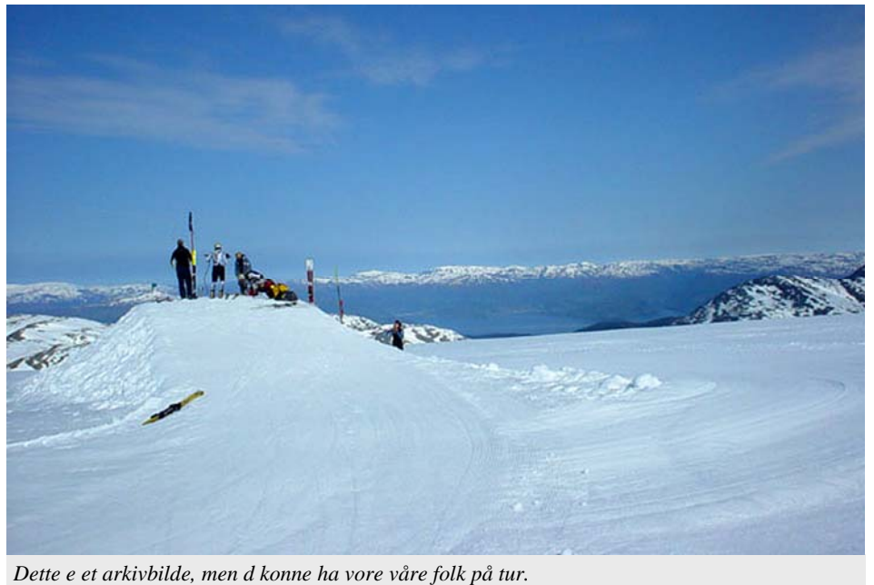
Dette e et arkivbilde, men d kunne ha vore våre folk på tur.

den siste dagen så alle (nesten) ville opp tiligast mulig for å utnyttat dagen. Alle pakka fort å gale så me kåm oss av gåre. Itte ein sjappe frokost reiste me. Denne dagen blåste d meir, så d va litt