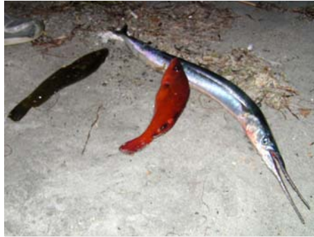
"Kan me bytta den lange stygge i 5 brø?"

blei folk delt inn i lag på fem og fem åsså va d bare for laga å finna seg en goe fiske plass. Alle laga hadde ca en time på seg å fiska, så her va det bare å komma i gang og finna den beste fiskeplassen.