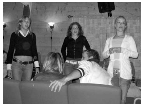
"Me låve å aldri skriva kos me z meir. Me låve å aldri..."

Mens me vridde hjernane våre konne me sitta og putta innpå nyplukka jordbær, herlig! Sånn, då va hjernane våre trimte nok og det va på tide å testa songstemmen og gjette kunsten: det va klart for mimelek og songlek, juhu! Å detta tok av! Adle va heilt i skyene og totalt maks gira, fantastisk! Stemningå va som du forstår heilt på topp heile kvellen. Hooh, her skjedde der masse kjekt!