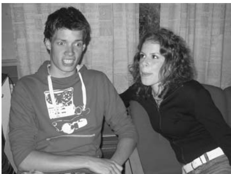
"Sjå! Sjå nå! Rikke eg på øyrene nå?"

Videre på min nysgjerrighetstur møtte eg fleire muntre smil, folk som potla på med sitt, og i kjøkkenkroken blei kveldens leker lagt heilt klare. Då klokka runda tjueein va det klart for å starta arrangementet offisielt, någe som blei gjort på ein rørende fine måte, nemlig med songinnslaget eg hadde fått