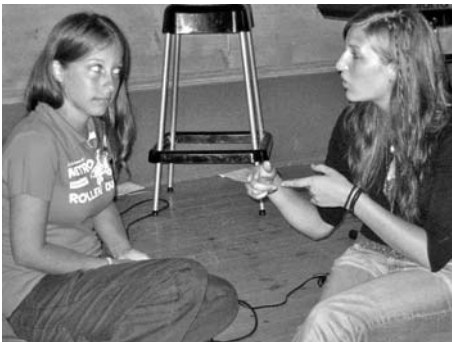
"Ja, åsså akkurat når eg sgo parkera atme bilen din, sånn, så stupte d ner ei måga å lagte den ribå i lakken din... Hæ? Nei, d e heilt fakta!"

Som oppvarming hadde me "fleip eller fakta" , som gjekk høglytt for seg mjudlå dei to lagå. Når adle va varme i trøyå bar det øve på leken som ga denne jentå svar på sine mange undringar: su doku...A- ha! Su doku e ein tal lek som e i ferd med å fortrenge det tradisjonella kryssordet i engelske aviser. Alle rekker, kolonner og 3*3 felt på brettet må inneholda talå 1 til 9., å det fins kun ein løysning! Et svært innvikla, spennande og utfordrane kryssord som du fort bler hekta på! Å det ska lite te for at du må