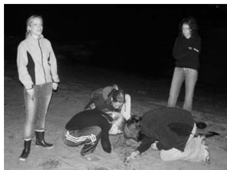
"5 789 568 sandkorn, 5 789 569 sandkorn, 5 789 6.. Fadderullan, nå myssta eg tellingå!"