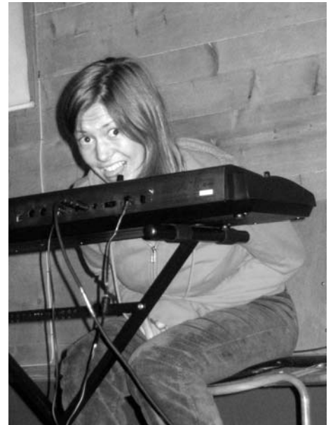
"Ka?! Eg presse jo alt eg kan!!"

begynna på nytt igjen. Så her gjaldt det om å holda tongå beint i monnen og ikkje la seg forstyrra av det som skjer rundt seg. Utruligt kjekt!