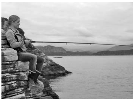
Ganske bra bilde

Ittekvart så tiå jekk kom der flerre og flerre folk tuslane. Så når klokka nærma seg hal ti kunne me endelig begynna. Då