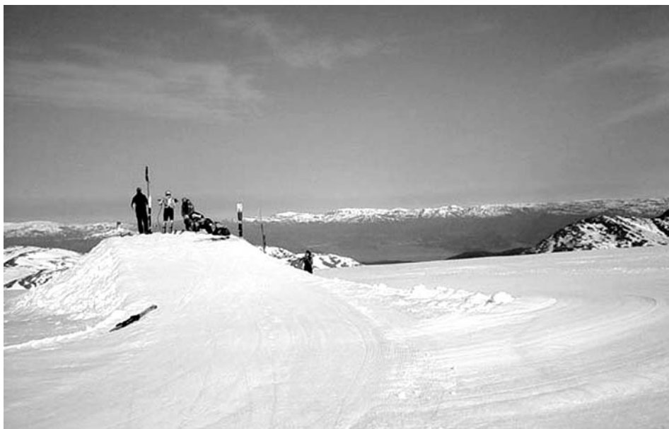
Dette e et arkivbilde, men d kunne ha vore våre folk på tur.

den siste dagen så alle (nesten) ville opp tiligast mulig for å utnyttat dagen. Alle pakka fort å gale så me kãm oss av gåre. Itte ein sjappe frokost reiste me. Denne dagen blåste d meir, så d va litt