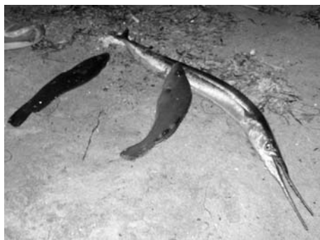
"Kan me bytta den lange stygge i 5 brø?"

blei folk delt inn i lag på fem og fem åsså va d bare for laga å finna seg en goe fiske plass. Alle laga hadde ca en time på seg å fiska, så her va det bare å komma i gang og finna den beste fiskeplassen.