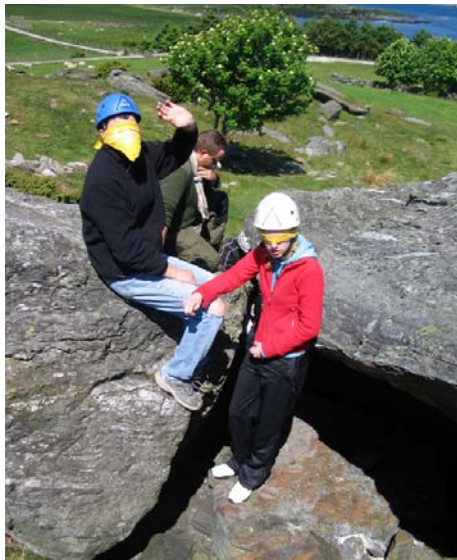
Kongsvigens extremeferiar: økonomiklassen