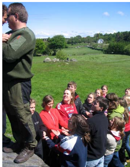
Trahaugen va særskjeptiske t Kongsvigen

Ein liten ting te slutt. Eg tenkte veldig møyje øve løftene som me ga kvarandre. Utrulig kor møyje som kan skje viss me klare å verr positive, støtta di andre og samtidig gjera så godt me kan. De e ein slags liden bibel i de og. Eg trur de må verr noye av de viktigaste ein kan ta med seg fra Bru, livet eller ka som helst om du vil.