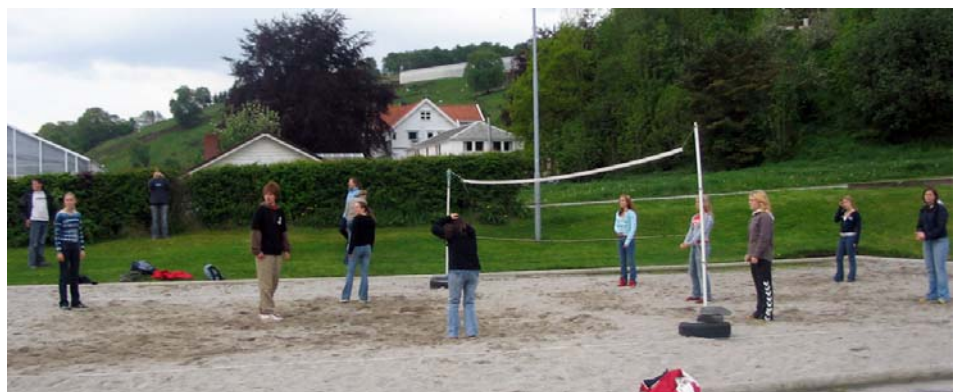
"Ja, hadde me bare hatt ein ball óg nå, så hadde kvellen jaffall blitt heilt konge"