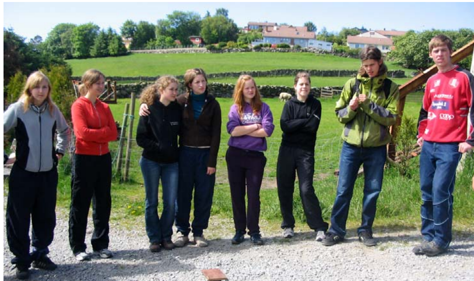
Eg visste eg sgo ha vore heima!" Terje e hallkalle t oppgavene