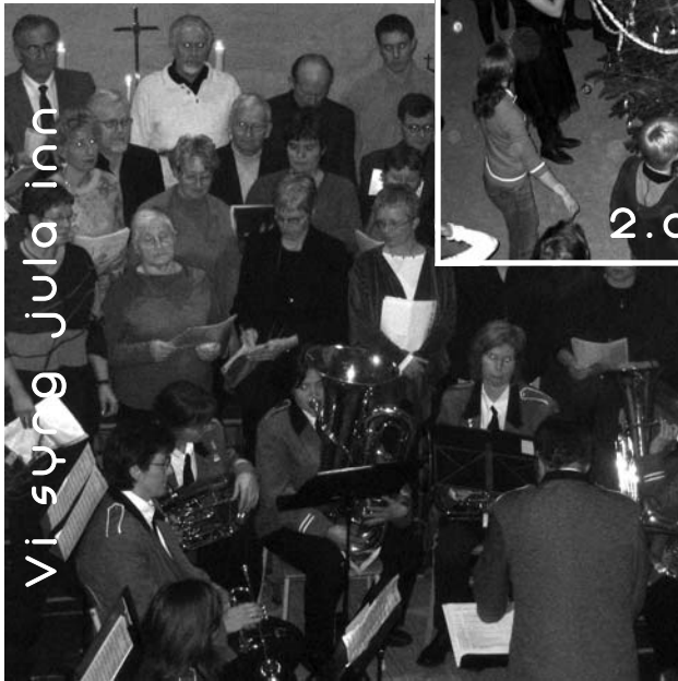
Vi syng jula inn