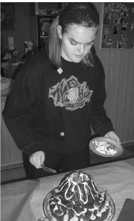
Mon tru om Serina Nessa e redd for et nytt vulkanutbrudd? Kagå fekk iallefall 2 prisar.

Årets kagegranprix sto aldri i fare for å ødelegga inventaret. Te det va oppmø-