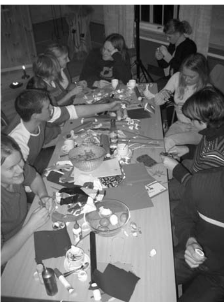
Munter stemning me gløgg, mandariner og julepynt i alle fasongar rundt på borde.