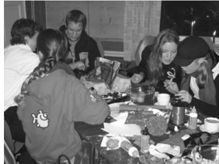
Någen e litt meir ivrige og konsentrerte i arbeide. Andre snur seg heller vekk.