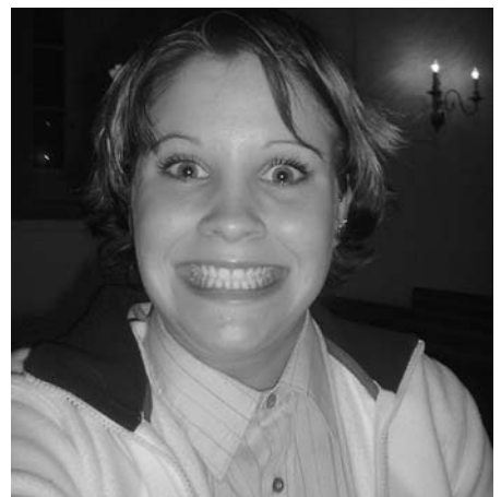
Tannlegens drøm: Fem stykker eplekaga, men plettfrige tenner.