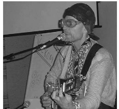
Sjefs ungar: Brakkvald Tolvstøkkje

Tøsen fortelle vidare at någen trudde at det sko gå isame duren så "Menn in mission", men d hadde visst ingen sammenheng. Denne kvelden sko var ny og utradisjonell. Di ville prøva å gjer någe nytt rett og slett.