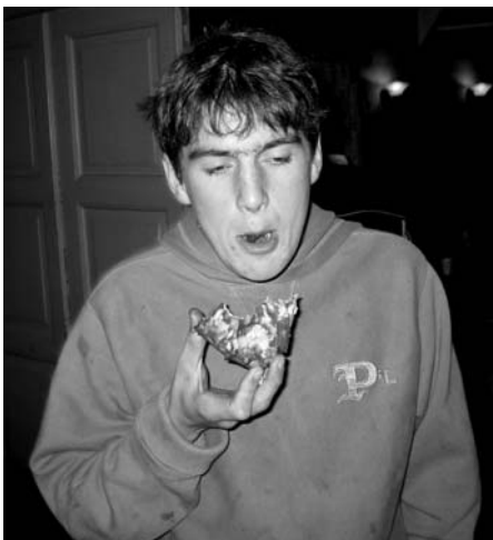
Pizza pizza: Grandiosa falt i smag blant de fleste og gjorde tv-kvelden komplett

Eg va den einaste så hadde dress. Den einaste. Og der va møje folk. Og ikkje