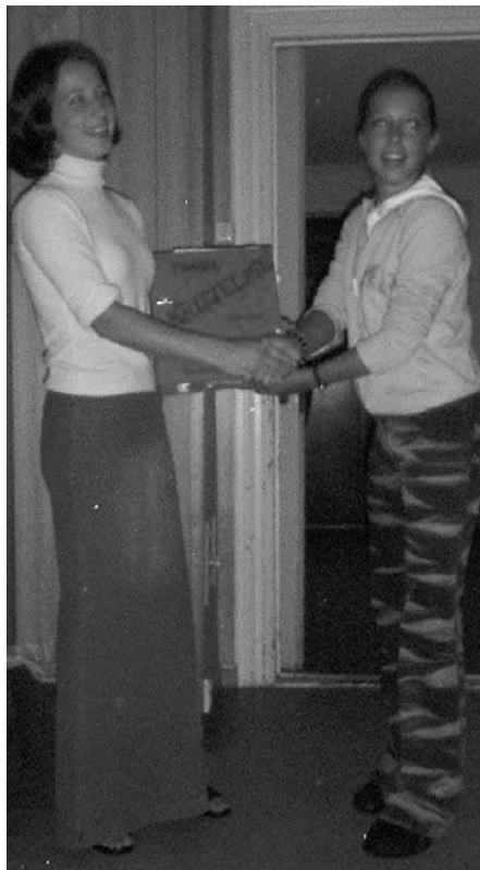
De onge øvtar for de eldre..