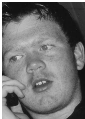
Ifølge artikkelforfattaren fortener denne mannen skrøyt for innsatsen sin i planleggina av nyttårsfesten